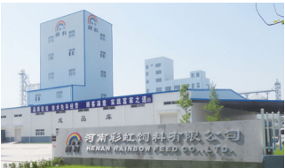
하남공장 HENEN PLANT, CHINA