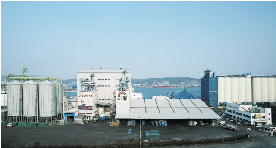
울산사료공장 ULSAN PLANT, KOREA