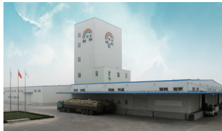
청도공장 QINGDAO PLANT, CHINA