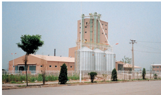
천진공장 TIANJIN PLANT, CHINA