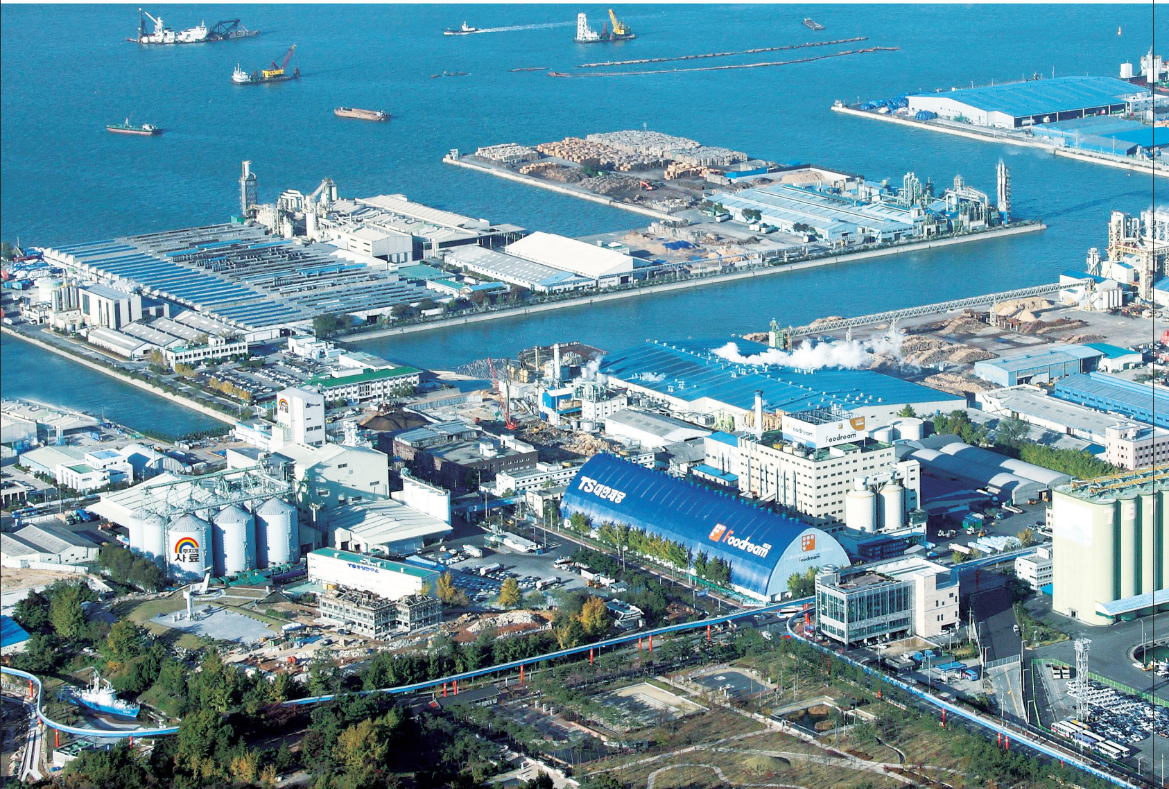
인천 제당·사료공장 전경 INCHEON PLANT, KOREA