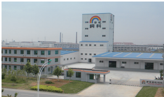
남경공장 NANJING PLANT, CHINA