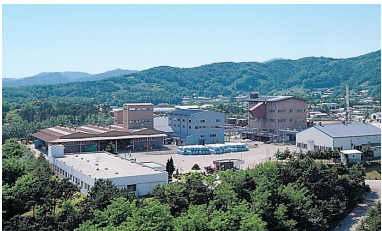
옥산공장 OKSAN BIO PLANT, KOREA